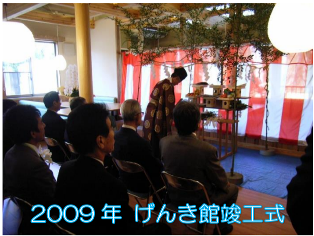
2009年 げんき館竣工式

の12月には、ご利用者からの「死ぬまでに、もう一度温泉に入りたい」との声を受けて、天然温泉を備えたデイサービスセンター鶴舞温泉げんき館が開設されました。平成24年8月には、特養トータスの増築棟である新館北ホテルが開設され、入所定員30名、短期入所定員10名が増員となり、合計定員100名の施設に生まれ変わりました。さらに翌年の平成25年7月には、げんき館の増築棟としてのんき館が開設し、1日の利用定員が72名となり、これを最後に、鶴心会における施設・事業所の整備拡充は一旦の区切りとなりました。そして長らくの年月を経