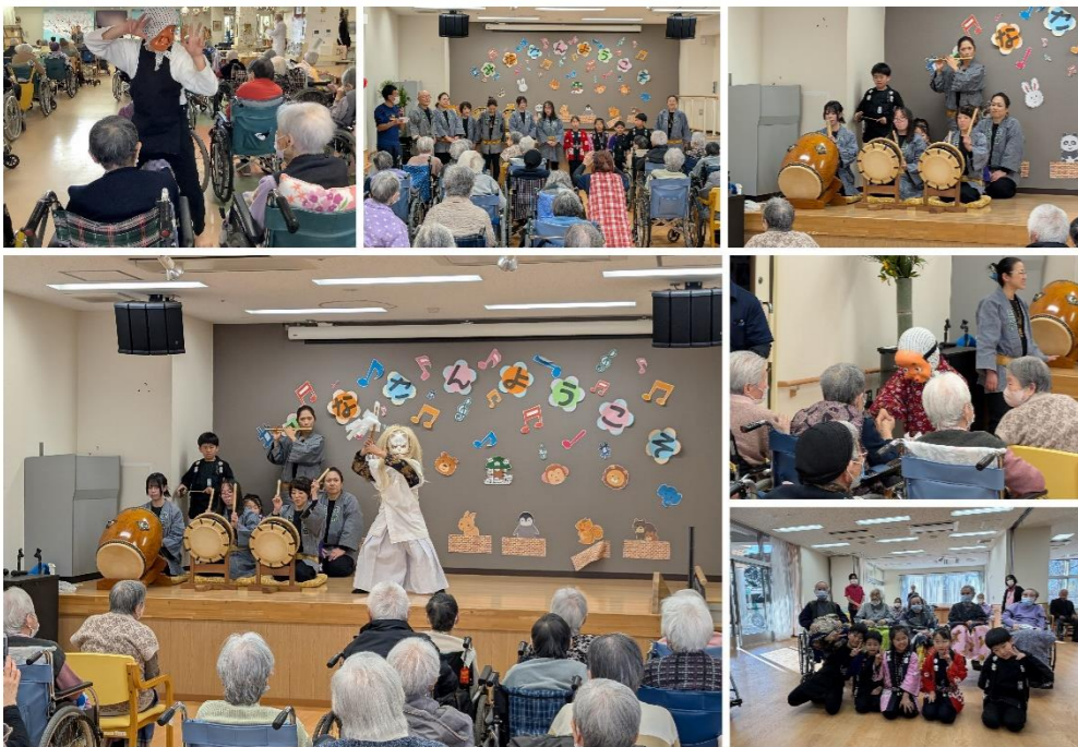
上宿祭囃子保存会の皆様、利用者様にあられる笑顔をありがとうございます