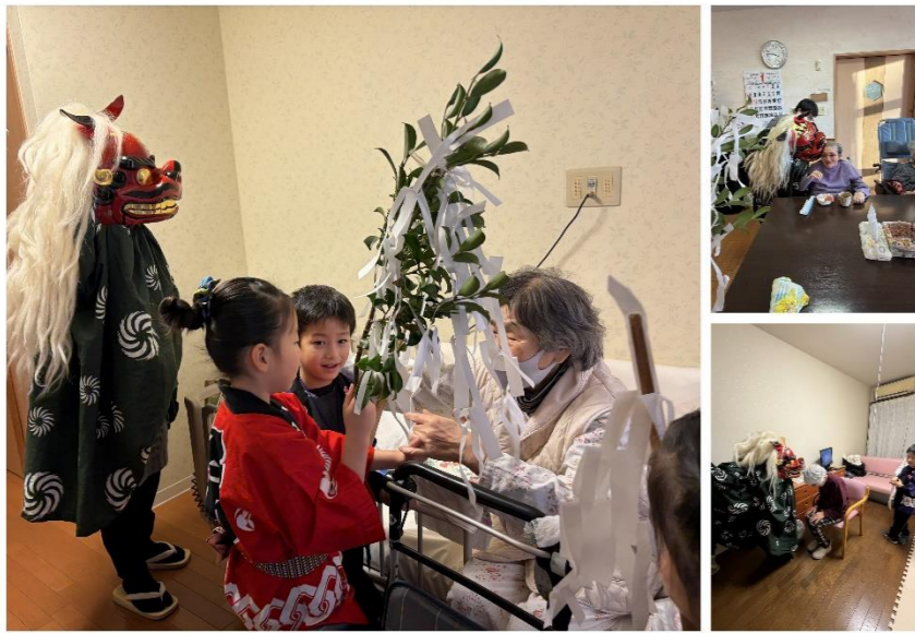
子供たちから、元気と笑顔をいただきました