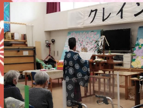
高滝神社神主様、健康祈願